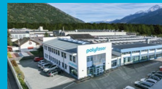
Sede a stabilimento a Prato allo Stelvio