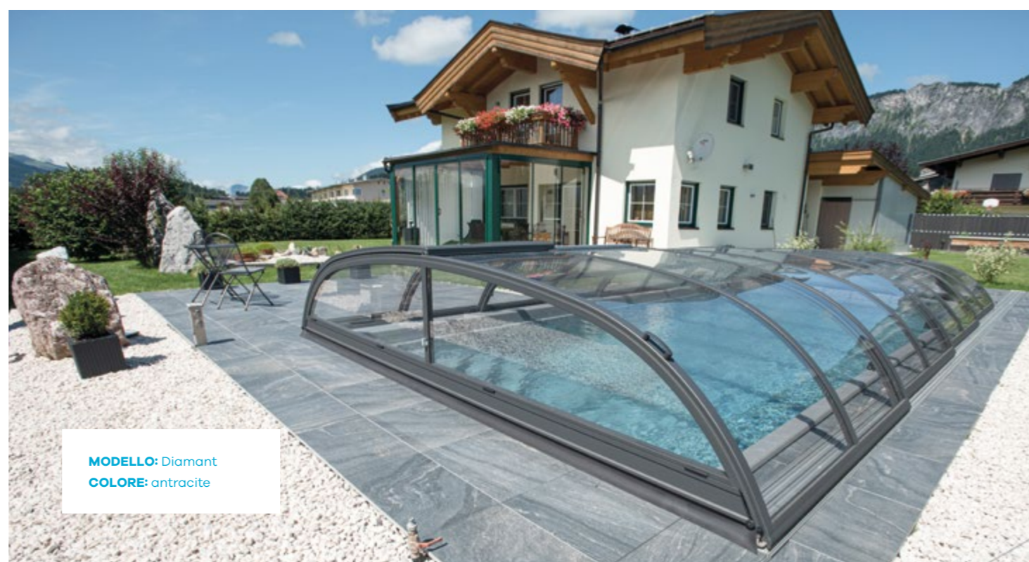
MODELLO: Diamant COLORE: antracite

I dati riportati possono essere oggetto di modifiche senza preavviso dovute a esigenze tecniche o produttive. I colori riportati nelle immagini possono risultare differenti rispetto a quelli originali.