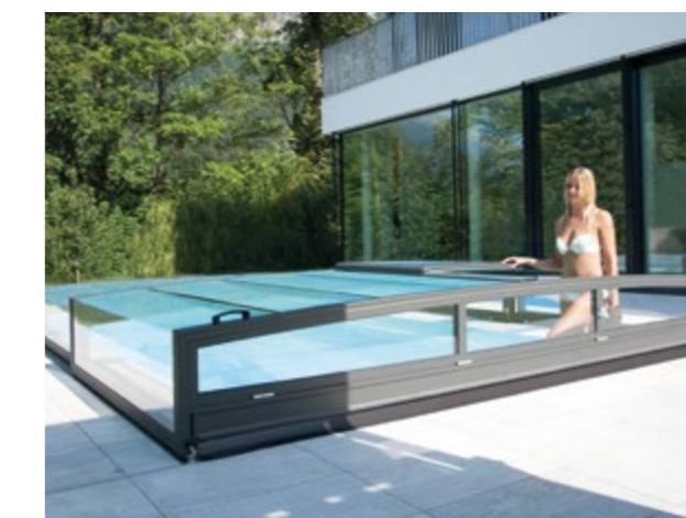
MODELLO: Opal COLORE: antracite