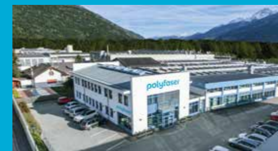
Sede a stabilimento a Prato allo Stelvio