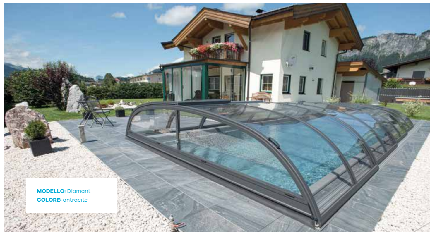
MODELLO: Diamant COLORE: antracite