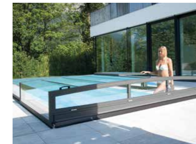
MODELLO: Opal COLORE: antracite