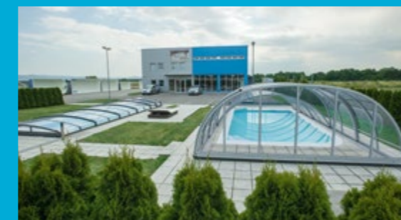
Filiale in Bad Fischau