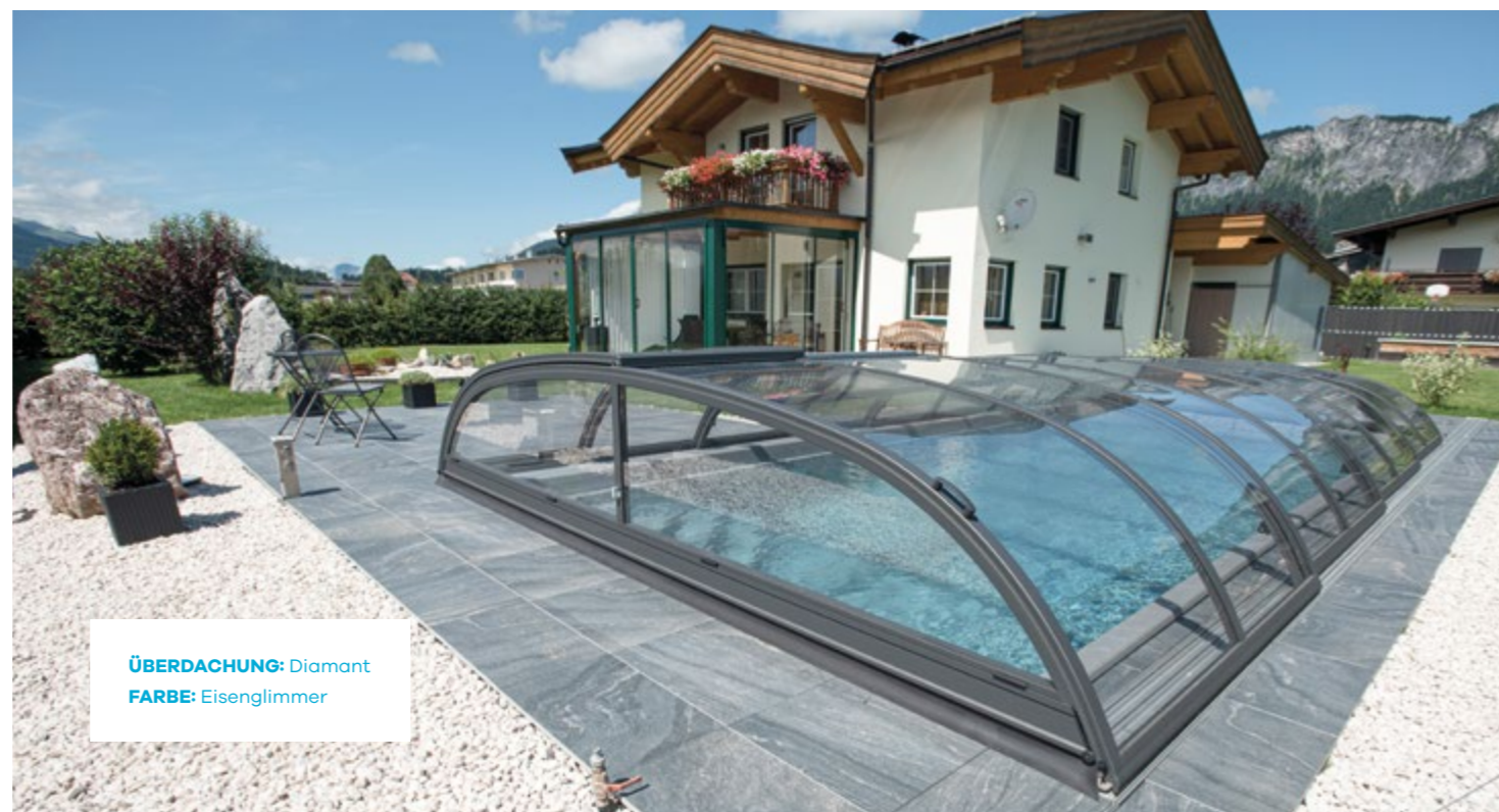
ÜBERDACHUNG: Diamant FARBE: Eisenglimmer