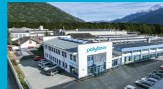
Sitz und Werk in Prad am Stilfserjoch

Unseren guten Ruf verdanken wir nicht zuletzt der sorgfältigen Planung, der termingerechten Lieferung, dem reibungslosen Einbau und der fachgerechten Installation unserer Pools.