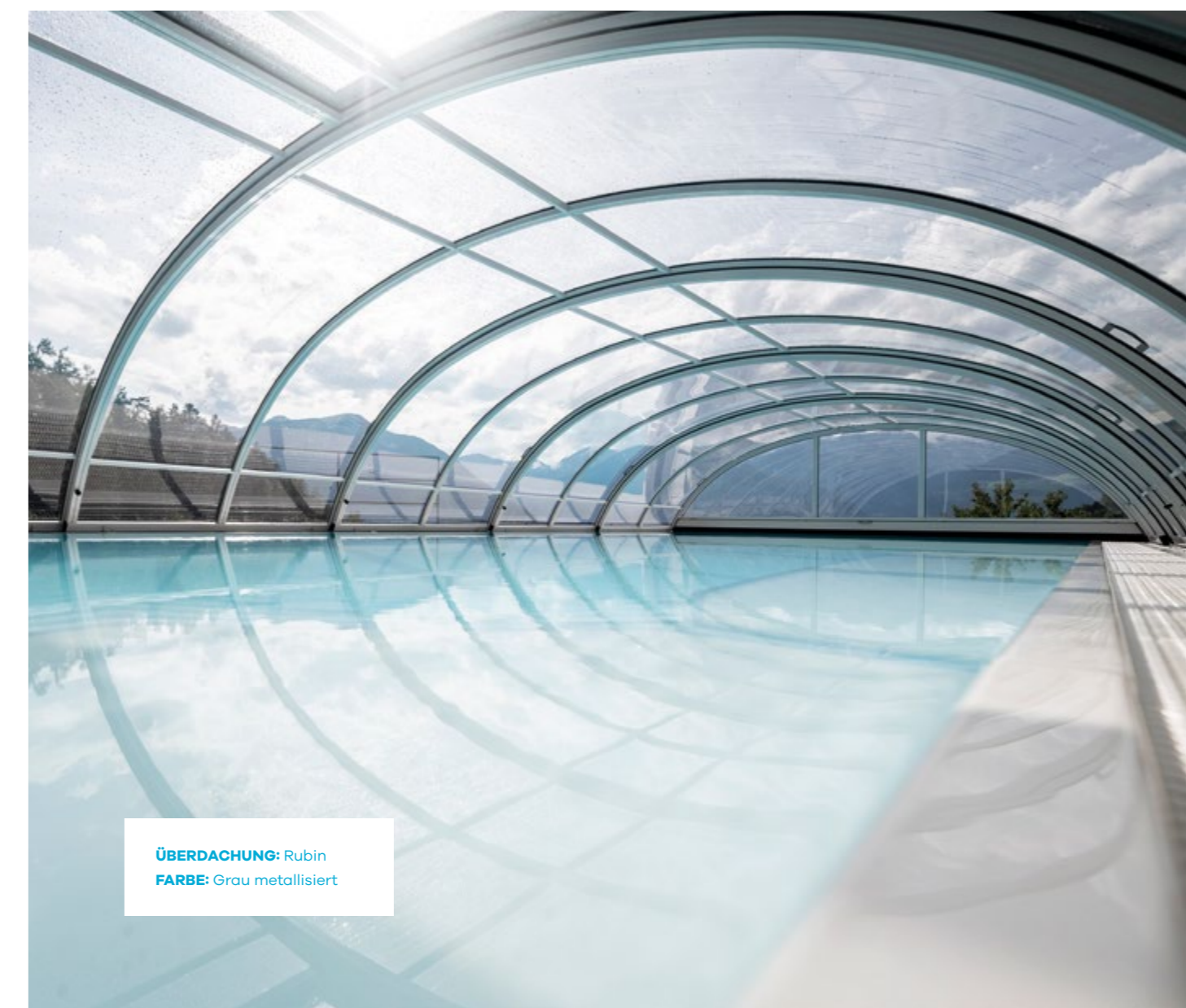
ÜBERDACHUNG: Rubin FARBE: Grau metallisiert

Druckfehler, produktionsbedingte Maßabweichungen und technische Änderungen vorbehalten. Die dargestellten Farben können von der Originalfarbe abweichen.